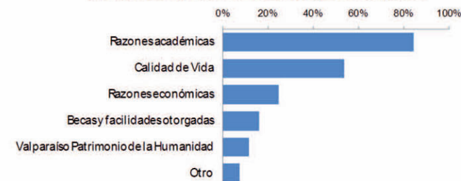
Motivaciones para estudiar en la Región de Valparaíso